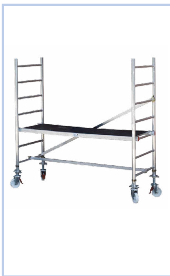
Z300 állvány A