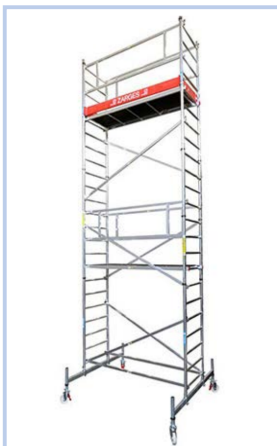
Z300 állvány A+B+C