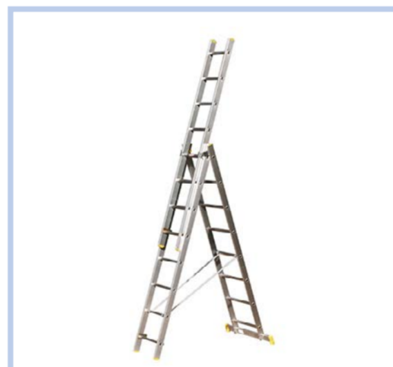
Eurostar létra háromrész 3x8