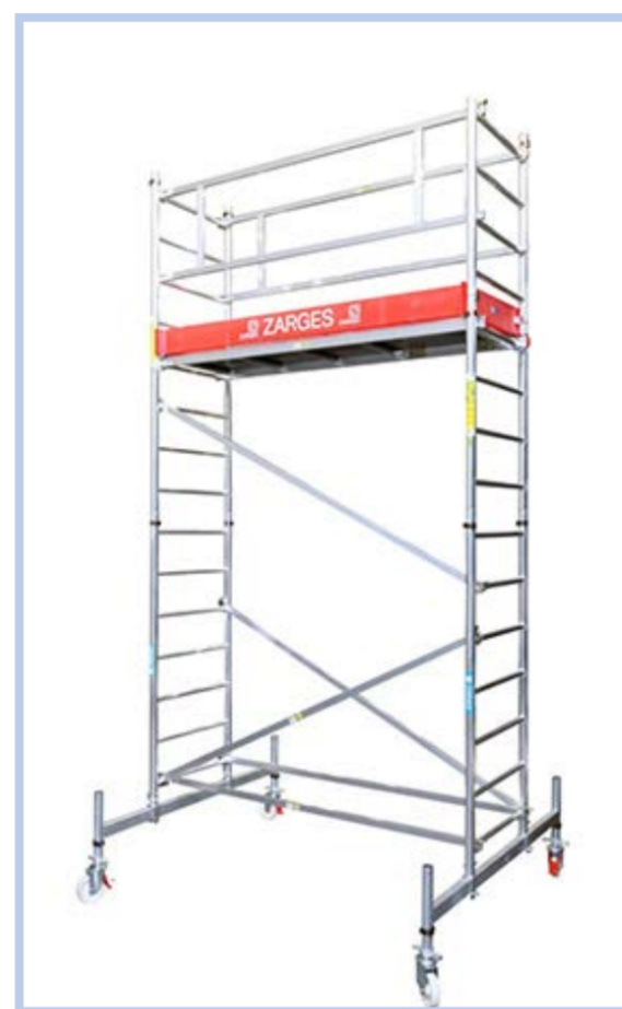
Z300 állvány A+B