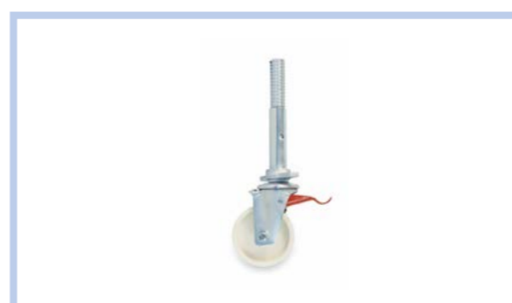
+4 db kerék